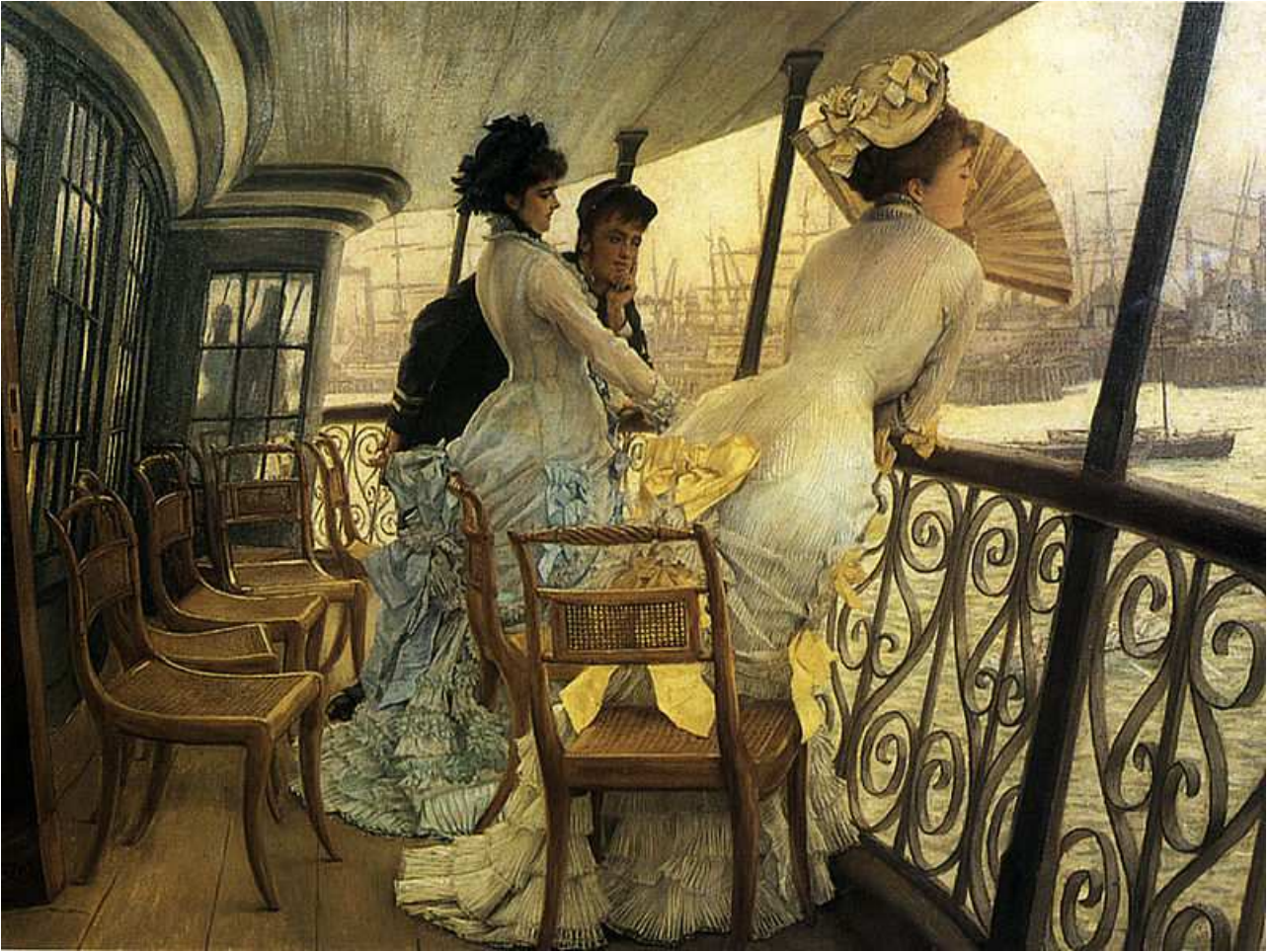
Le pont du H.M.S. 'Calcutta' (Portsmouth), vers 1877