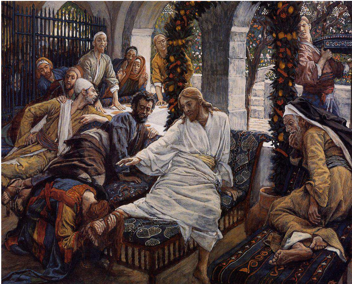
Marie-Madeleine, la pécheresse, essuyant les pieds de Jésus avec ses cheveux

Il consacre ses dernières années à la peinture de scènes de l'Ancien Testament.