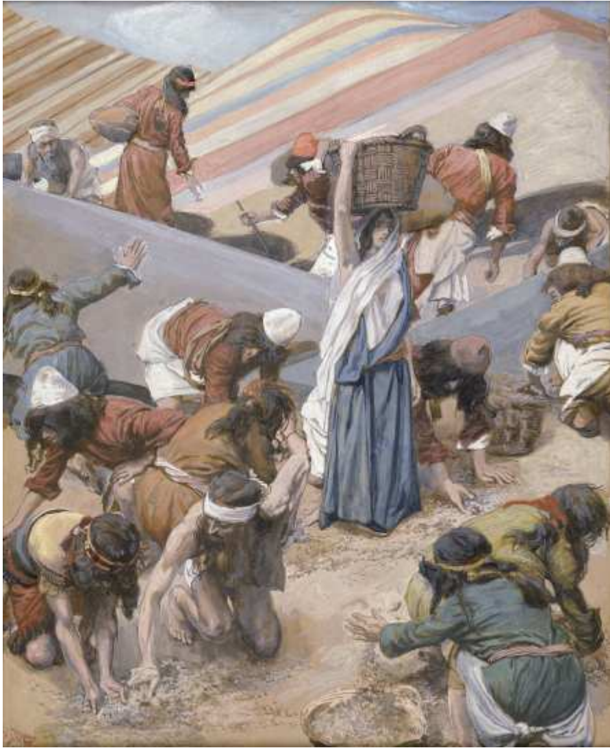
Les Hébreux ramassant la manne.